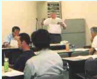
▲新潟県緑花推進計画 —新たな5ヵ年計画—