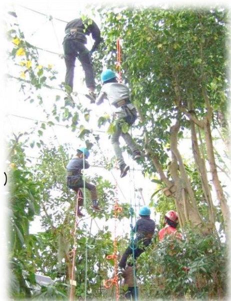
ドーム内でツリークライミング! (6才以上のお子様対象)

問合わせ・申込み 一般社団法人 新潟県公園緑地建設業協会 〒950-0951 新潟県新潟市中央区鳥屋野438番地 TEL 025-282-4460 FAX 025-282-4461 e-mail niigataken@koryoku.or.jp ※お申込の詳しくは裏面をご覧ください。